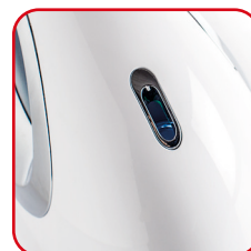
Uscita vapore Mist outlet