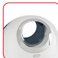
Design accattivante e cura dei dettagli Appealing design and attention to details