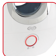
Manopola retroilluminata multifunzione Backlit multifunctional knob